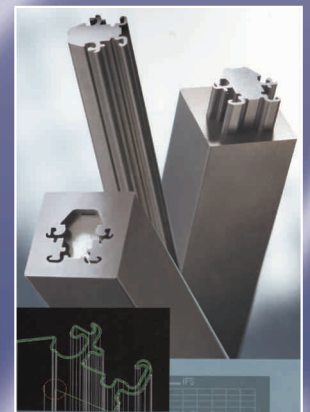
Absolute Wiederholbarkeit der Bearbeitungen